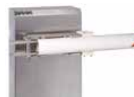
Uchwyt mocowania ramienia owalnego wychylnego - (INOX)

Nie ma możliwości instalacji fartucha, podpórki pod ramię lub podpory stałej na nowych ramionach wychylnych.