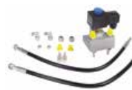
Zawór ANTY-PANIK ♦