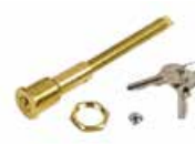
Mechanizm odblokowujący z kluczem