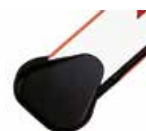
Mocowania do ramion prostokątnych lub owalnych ♦

Ramiona prostokątne posiadają gumowe zabezpieczenia przeciwuderzeniowe. Ze względu na właściwe wyważenie ramienia, aktywne zabezpieczenia nie mogą być instalowane na ramieniu.