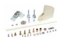
Zestaw łamania do ramienia szlabanu - maks. wysokość pomieszczenia 3 m (tylko do standard. ramion prostokątnych)