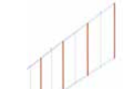
Fartuch 2 m pod ramię szlabanu ♦