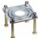
Podstawa fundamentowa do podpory stałej