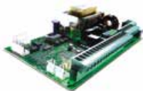
Wbudowana centrala sterująca 624 BLD