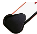
Uchwyt mocujący do ramion prostokątnych ♦

Ramiona prostokątne posiadają gumowe zabezpieczenia przeciwuderzeniowe. Ze względu na właściwe wyważenie ramienia, aktywne zabezpieczenia nie mogą być instalowane na ramieniu.