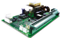
Wbudowana centrala sterująca 624 BLD