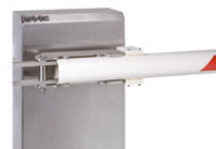
Uchwyt mocowania ramienia okrągłego wychylnego - (INOX)

Nie ma możliwości zamontowania "firanki", podpory ruchomej czy też podpory stałej w przypadku okrągłych ramion wychylnych.