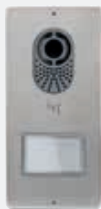
Lithos 1 przycisk

Lithos można wyposażać w pojedyncze lub podwójne przyciski, w zależności od rodzaju instalacji do zrealizowania (do 4 wywołań). Ich wymiana, jak w przypadku wkładania tabliczek z nazwiskiem, jest bardzo prosta.