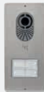
Lithos 4 przyciski