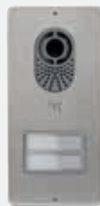
Lithos 2 przyciski