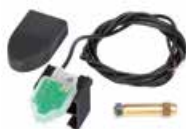
Opcjonalny magnetyczny enkoder absolutny (SAFEcoder) - PATENT FAAC