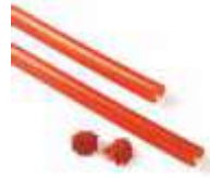
XBA13 listwy ochronne, gumowe, czerwone na ramię XBA 9x1 m 140,00 172,20 brutto