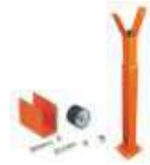
WA11 podpora ramienia stała, regulowana wysokość 300,00 369,00 brutto