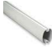
XBA5 ramię aluminiowe, owalne, 69x92x5150 mm 360,00 442,80 brutto