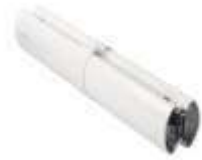
XBA9 łącznik do ramion XBA15/XBA14/XBA5 80,00 98,40 brutto