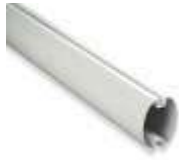
XBA15 ramię aluminiowe, owalne, 69x92x3150 mm 300,00 369,00 brutto