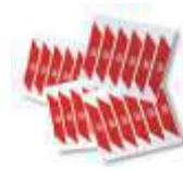
WA10 nalepki ostrzegawcze na ramię szlabanu (24 szt.) 80,00 98,40 brutto