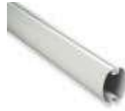
XBA14 ramię aluminiowe, owalne, 69x92x4150 mm 330,00 405,90 brutto