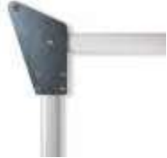
WIA11 przegub dla ramion XBA19 WIDEM 400,00 492,00 brutto